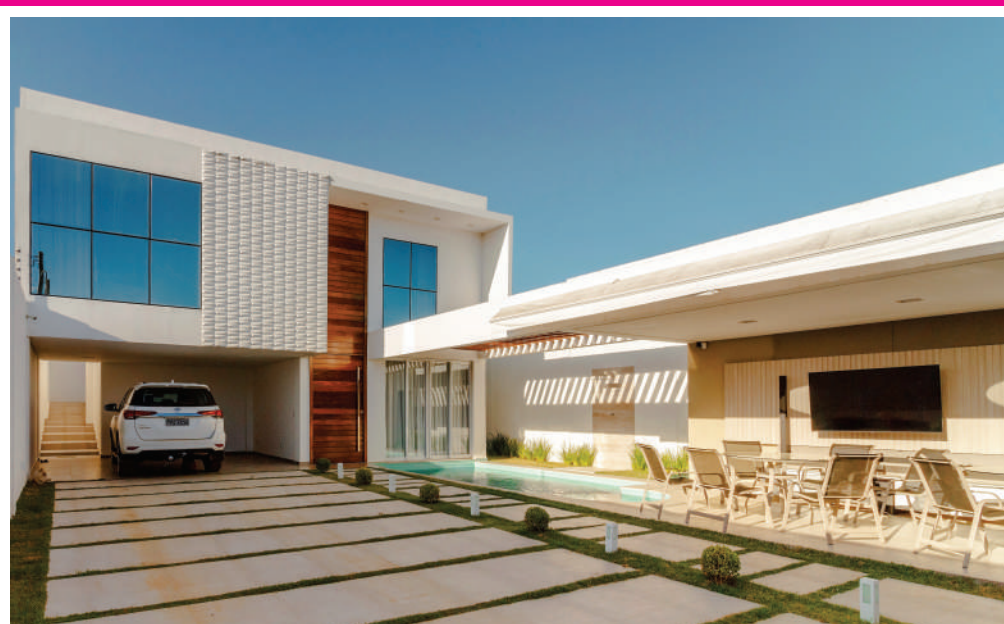
CRÉDITO - CASA RETRATO